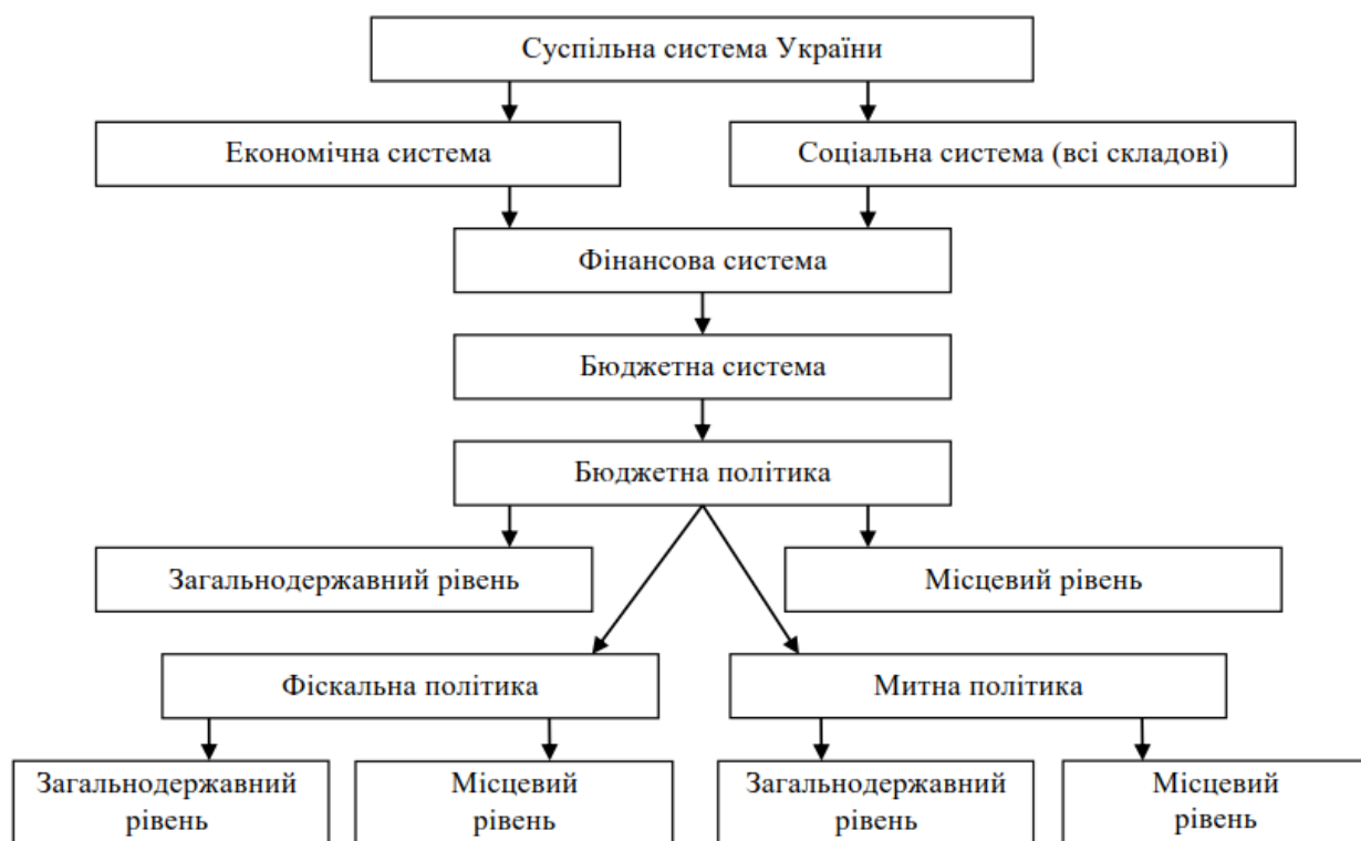
Рисунок 1.1 – Місце бюджетної політики місцевого рівня у суспільній системі України [3]

Місце бюджетної політики в суспільній системі України зображено на рис. 1.1.